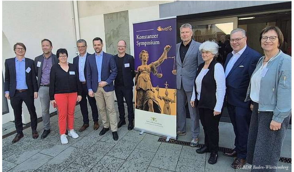
Die Teilnehmerinnen und Teilnehmer befassten sich in diesem Jahr mit einem aktuellen und schwierigen Thema. In den Vorträgen wurde dieses von verschiedenen Seiten beleuchtet.