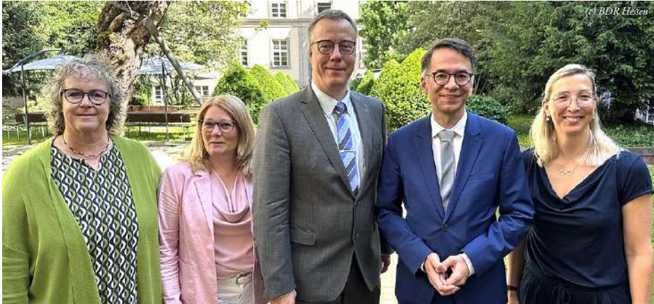
Im Mittelpunkt standen namentlich die weiterhin hohe Belastung der Rechtspflegerinnen und Rechtspfleger sowie die Mitarbeitergewinnung und -bindung..

Am 22. Mai ging der BDR Hessen in den Austausch mit dem Justizminister unter anderem über Fragen zur Justiz in der Fläche, die hohe Arbeitsbelastung und den Generationenwechsel.