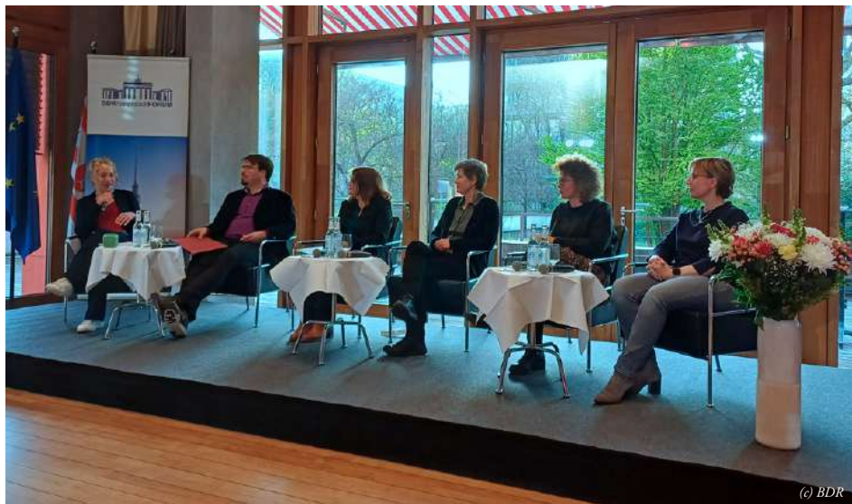
Die Betreuungsrechtsreform von 2023 mit den Nachbesserungen aus dem Jahre 2025 ist ein guter Anfang, rechtliche Betreuungen zu einem echten Schutzschirm für Betroffene zu machen. Dennoch bleibt noch viel zu tun.

Ein zentraler Diskussionspunkt war die Frage, ob mehr Selbstbestimmung auch mehr Risiko bedeutet. Die Antwort fiel