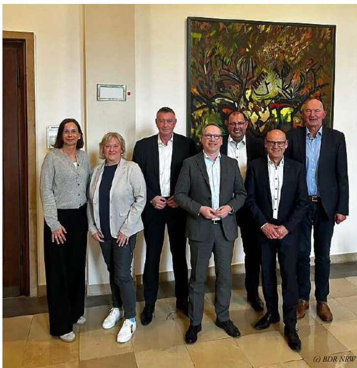
Der BDR NRW im Dialog mit dem Justizminister Benjamin Limbach.

Darüber hinaus wurde die Frage der Definition von häuslicher Gewalt ausdrücklich angesprochen. Unterschied-