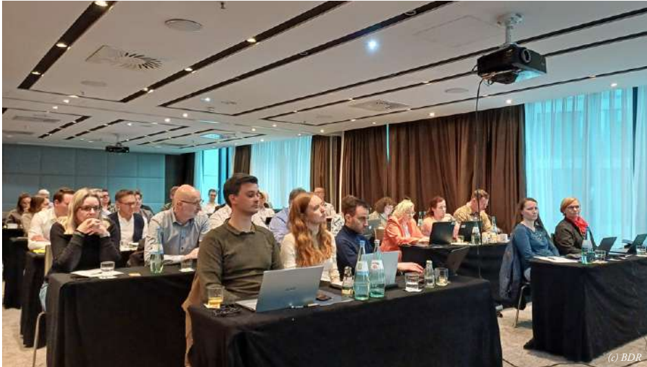
Im Fokus der Tagung standen aktuelle Entwicklungen in Gesetzgebungsverfahren..

A m 20. April 2026 trafen sich im Hotel Eurostars im Herzen Berlins die Vorsitzenden der Landesverbände, Mitglieder verschiedener BDR-Kommissionen sowie die Bundesleitung zur ersten Präsidiumssitzung in 2026.