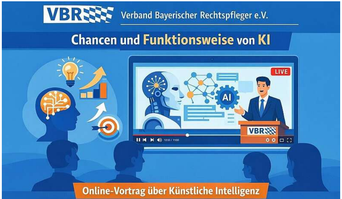
Beispiel einer mittels GPT Image generierten Grafik. Laut „Prompt“ sollte diese im Stile des Flat Design erstellt werden.

Wie funktioniert Künstliche Intelligenz (KI) hinter ChatGPT, Gemini und Co.? Welcher rechtliche Rahmen ist in der Justiz zu beachten und in welchen Bereichen kann der Rechtspflegerdienst von der Technologie profitieren?